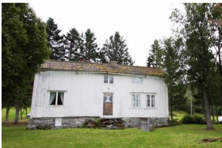
Blomen fra 1830-årene: Sannsynligvis den eldste, bevarte huset på Løvdal

En del praktiske gjøremål knyttet til vedlikehold og tilrettelegging kan overlates til kommuner, organisasjoner, skoler og grunneiere på bakgrunn av en faglig vurdering og ved at det inngås en skjøtelsesavtale.